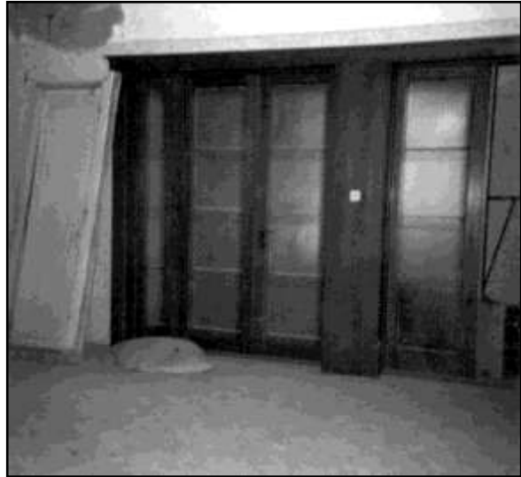
A fából készült koloniál jellegű ajtó, a hall bejárata 21