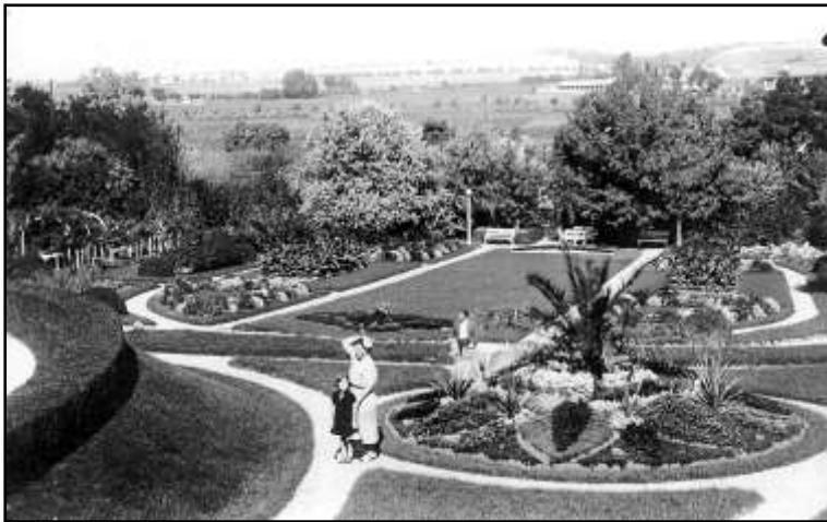
A Villa 1. áptolt parkja 17