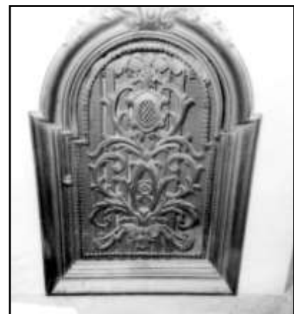
A márványkandalló ajtaja

A márvány kandalló, mely 2000 nyarán még a helyén állt, de a tulajdonos váltásokat már nem élte túl.