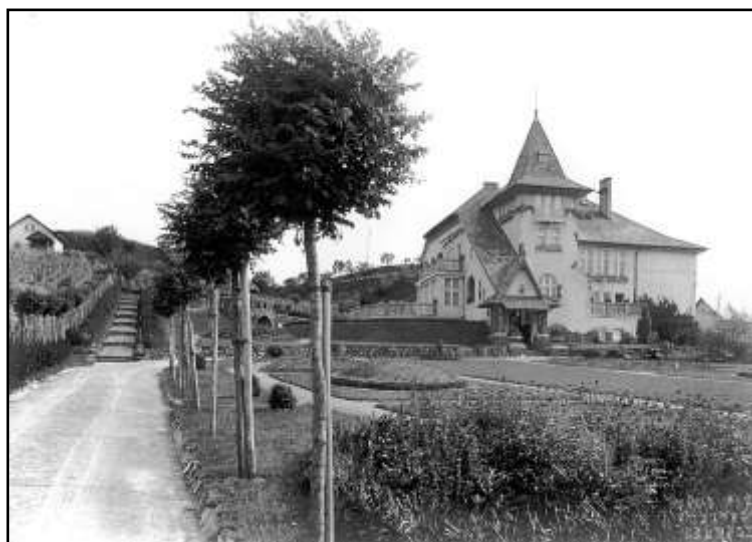
A Villa 1. dél-keletről 9 és észak-keletről 10