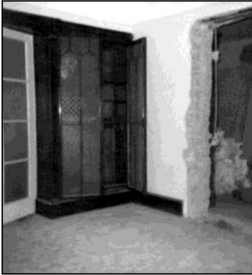
A beépített könyves szekrény