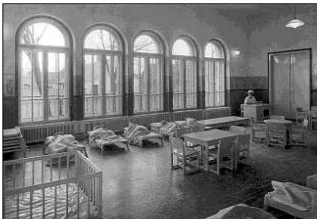
A napközi otthon belseje 1. 9