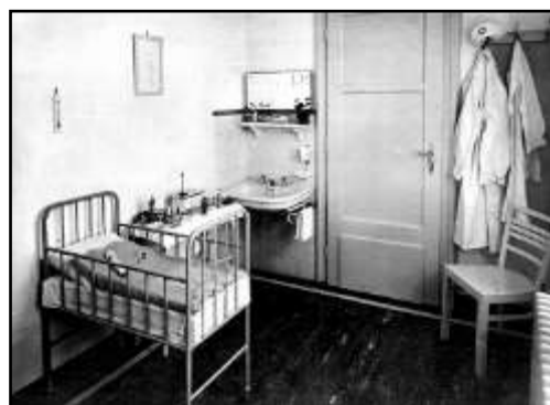
Elkülönítő – betegszoba 12