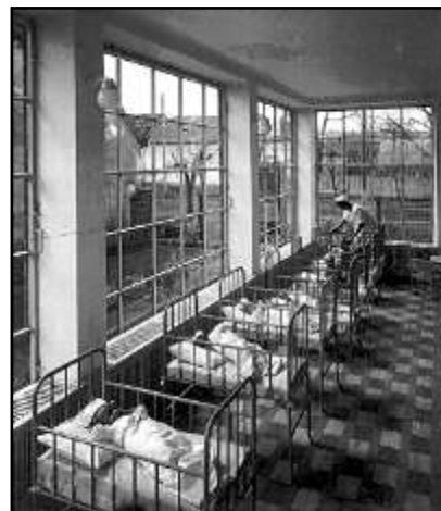
A napközi otthon belseje 2. 10