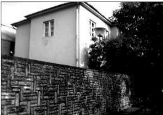
A Fried bölcsőde a Gyár utcában működött 1936-tól. A háború alatt nem üzemelt. A II. világháborúban megrongálódott. A helyreállítás nyomán emeletet építettek rá. A bölcsőde helyén 2000-ig a porta, fölötte pedig irodaház volt. 5