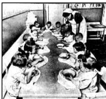
Étkezés közben 14