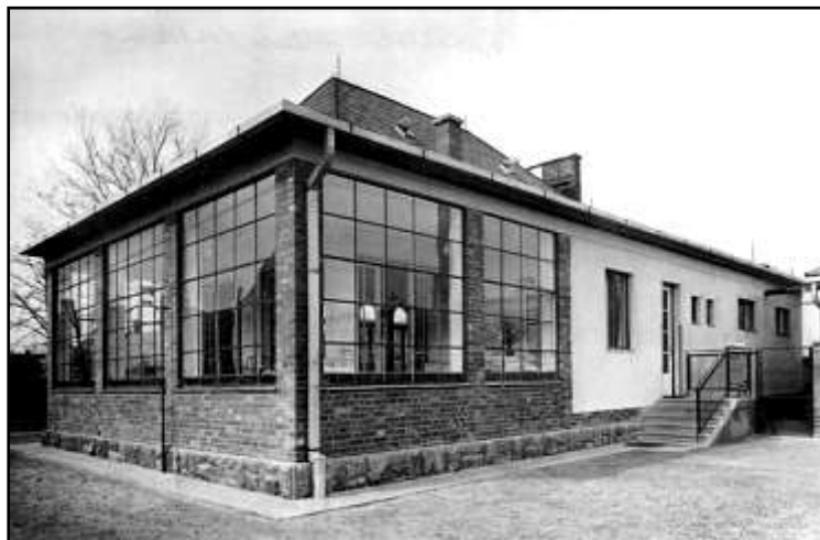
A napközi otthon udvari homlokzata 6