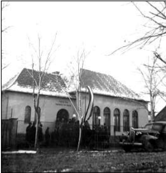
A Fried Pál Napközi Otthon utcai homlokzata. 3