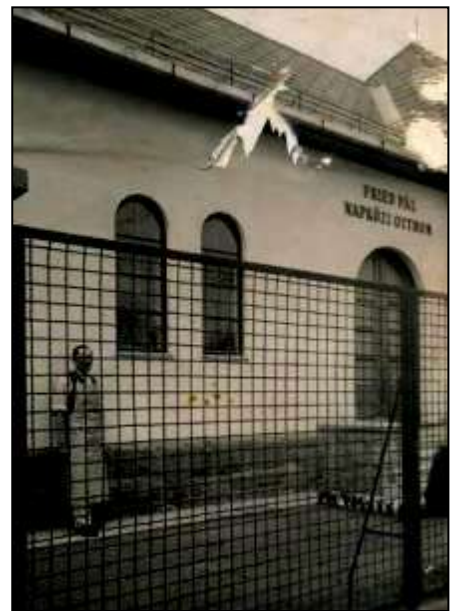
A bölcsőde előtt Gremesperger Károly, aki akkor az otthonban dolgozott. 4