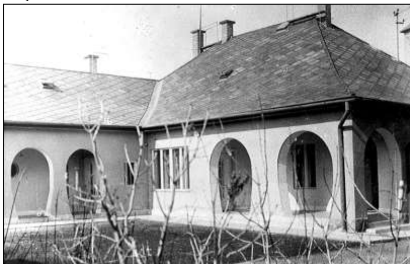
Az épület udvara az orvosi rendelő és orvosi lakás idejében.