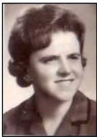
Az első tablóképen 1966-ban

Úgy emlékszik vissza, hogy csodálatos négy év volt, amit még egy évvel megtoldott, mint helyettes osztályfőnök, majd fájó szívvel nyugdíjba vonult! Az új igazgatónak egy levelet hagyott hátra, aminek legfontosabb pontja az volt: „Senkinek ne fizess rosszal a rosszért!” – ez sokszor nem könnyű, mert az ember megtehetné. De ha feladatként vállalja valaki a vezetést bármilyen szinten, tudnia kell azt, hogy el is kell majd számolnia egyszer. Még ma is úgy gondolja, hogy a vezetés nem hatalom, hanem szolgálat. – E szerint próbált cselekedni 22 éves vezetői munkássága alatt.