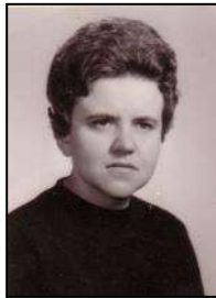
Férje halála után 1969-ben