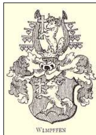
A Wimpffen család grófi címere