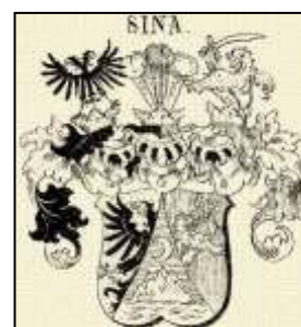
A Sina család bárói címere

Nem sokáig tartott az Eszterházyak uralma, 1820. március 15-től 698.500.- váltóforintért a görög származású bárói rangra jutott Sina Simon bécsi bankár kezébe került a simontornyai uradalom.