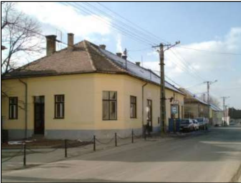
Pillich Ferenc hajdani gyógyszerháza a Fő utcán, a mai Szent István utcán